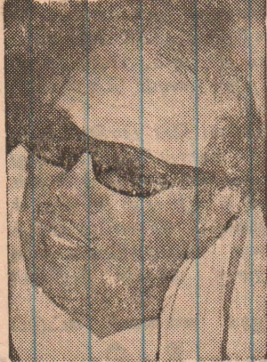
நிபந்தனைகளை விதிப்பதை விடுத்து சகலரினதும் பாதுகாப்பை உறுதிப்படுத்தும் விதத்தில் நடவடிக்கைகளை எடுக்க வேண்டும். அவ்வாறானால்தான் நாம் பொலிசார்

இத்தகைய சித்திரவதைகளை நிறுத்துமாறு சி. பி. ஐ. அதிகாரிகளுக்கு பிரதமர் பி. வி. நரசிம்மராவும் மத்திய உள்நாள் அமைச்சர் எஸ். வி. சுவாநாமும் அறிவுறுத்த வேண்டும் எனவும் கருணாநிதி தனது அறிக்கையில் தெரிவித்துள்ளார்.