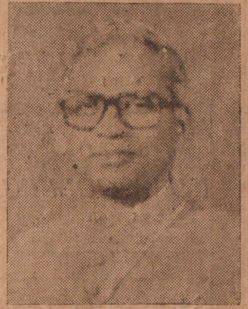
யாழ்ப்பாணம் போது அவரின் கை எழுப்பி எழுதி தெரிவிக்கப்பட்டுள்ளது (5 ஆம் பக்கம் பார்க்க)