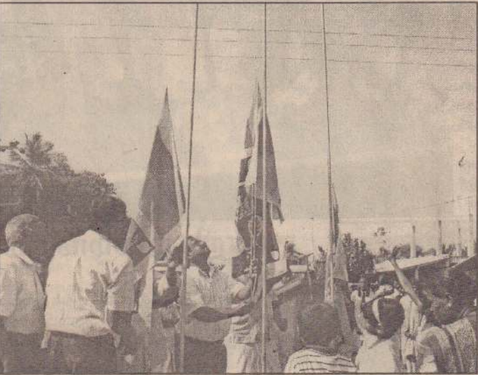
இந்நிகழ்வுகளில் பெரும் எண்ணிக்கையான மக்களும், மாணவர்களும் கலந்துகொண்டனர். (203-288)