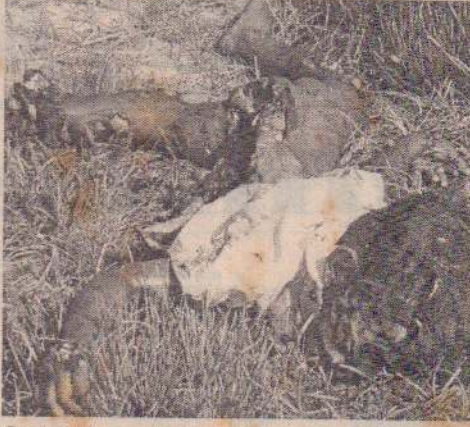
பேர் படுகாயமுற்றனர். இரண்டு நாட்களிலும் மொத்தம் 134 மக்கள் கொலையுண்டதுடன் 208 பேர்

இணையத்தளங்கள் வெளியிட்ட விவரங்கள் வருமாறு:-