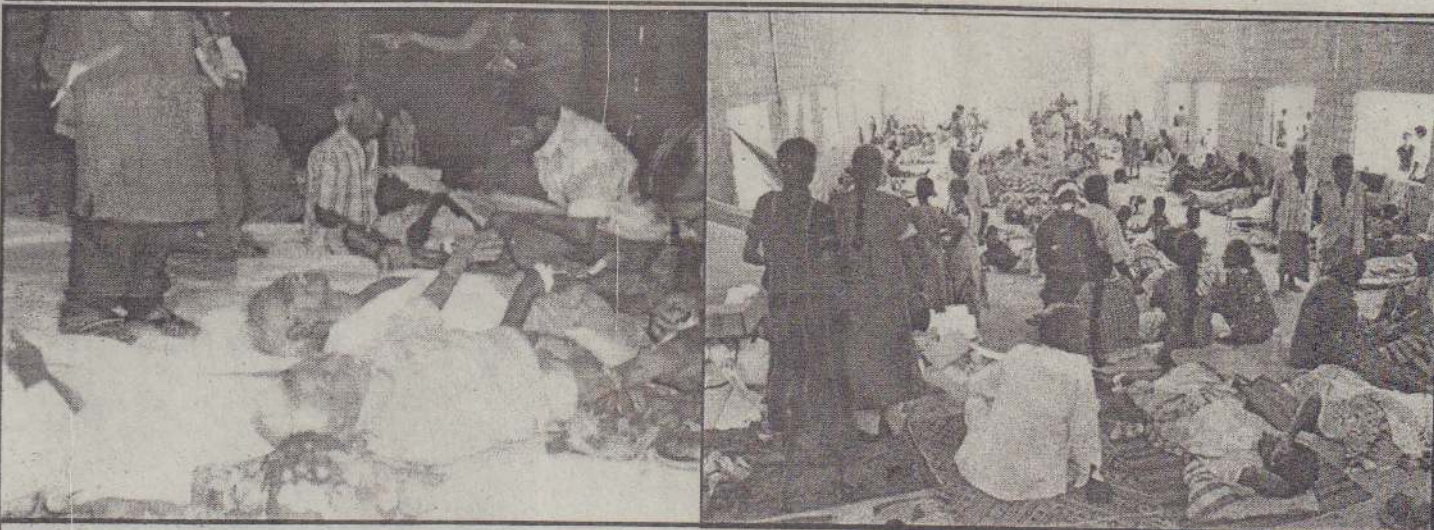
நேற்று முன்தினம் புதுமாத்தளம் மீது மேற்கொள்ளப்பட்ட பிரங்கித் தாக்குதலில் முதியோர் இல்லத்தில் தங்கியிருந்த முதியோர்கள் கொல்லப்பட்டுக் கிடப்பதை முதலாவது படத்திலும், புதுமாத்தளம் வைத்தியசாலையில் காயமடைந்தோர் சிகிச்சை பெறுவதை இரண்டாவது படத்திலும் காணலாம்.