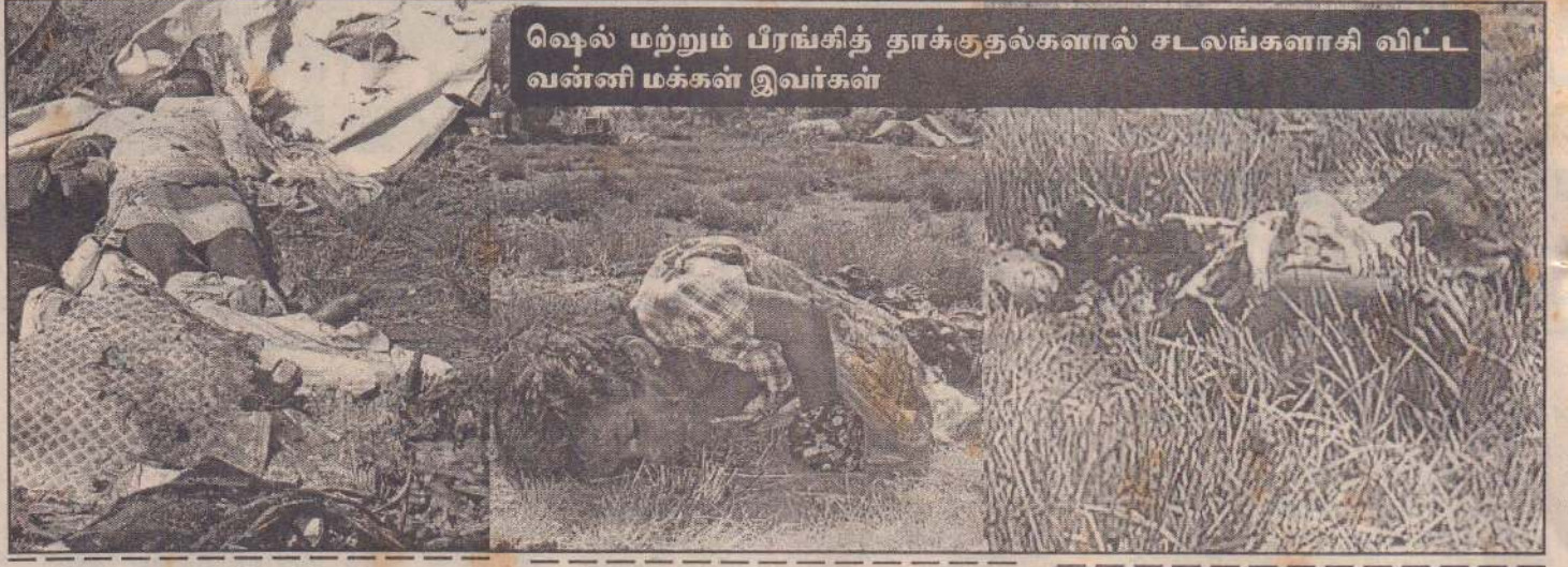
ஷெல் மற்றும் பிரங்கித் தாக்குதல்களால் சடலங்களாகி விட்ட வன்னி மக்கள் இவர்கள்