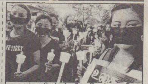
ஈழத் தமிழர்கள் மீது இலங்கை இராணுவம் நடத்தி வரும் தாக்குதலை தடுத்து நிறுத்தக் கோரி சென்னையில் நேற்றுமுன்தினம், மெழுகுவர்த்தி ஏந்தி அமைதி ஊர்வலம் நடத்திய திபெத்திய மாணவர்கள்.....

இலங்கைக் கடற்படையைக் கண்டித்து இராமேஸ்வரம் மீனவர்கள் நடத்திவரும் தொடர் வேலைநிறுத்தப் போராட்டத்தால் 30 ஆயிரம் பேர் வேலையிழந்துள்ளனர் எனத் தெரிவிக்கப்படுகிறது. இதுகுறித்து மேலும் தெரிவிக்கப்பட்டிருப்பவை வருமாறு - கடலுக்கு மீன்பிடிக்கச் செல்லும் இராமேஸ்வரம், பாம்பன் பகுதியைச் சேர்ந்த மீனவர்கள் மீது இலங்கைக் கடற்படை தொடர்ந்து தாக்குதல் நடத்தி வருகின்றமையைக் கண்டித்து, கடந்த 2 ஆம் திகதி முதல் இராமேஸ்வரம், பாம்பன் பகுதியைச் சேர்ந்த 15,000 நாட்டுப்படகு மீனவர்கள் வேலை நிறுத்தத்தில்