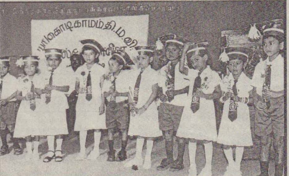
கொடிகாமம் திருநாவுக்கரசு மகாவித்தியாலயத்தில் அண்மையில் நடைபெற்ற தரம் ஒன்று மாணவர்களின் கால்கோள் விழாவின்போது விழா மண்டபத்தில் மாணவர்கள் பூச்செண்டுடன் நிற்பதைக் காணலாம்.