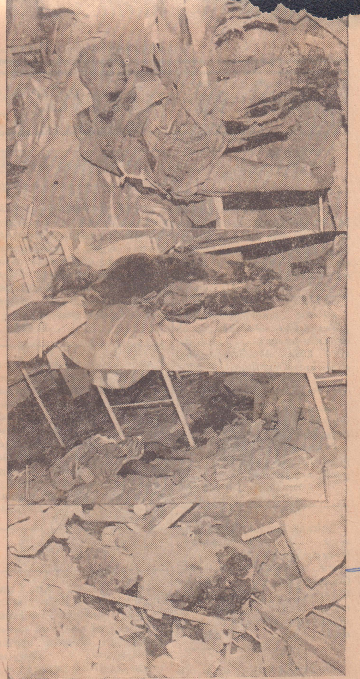
ஆஸ்பத்திரி 'ஷெல்' கொடூரத்தில் உயிரிழந்தவர்களின் சடலங்களைப் படத்தில் காணலாம்.

எழுத்தில்வரணிக்கமுடியாத பட்டது. அளவுக்கு நேற்றைய யாழ். யாழ். கோட்டை இராணுவ ஆஸ்பத்திரி ஷெல் தாக்குதல் முகாமிலிருந்து யாழ் ஆஸ்பத்திரி அவலநிறைந்ததாகக் காண்பதிரி மீது மேற்கொள்ளப்பட்ட ஆறாவது ஷெல் தாக்குதலாகவும், 19-ம் வார்ட்டை நோக்கி தீர்க்கப்பட்ட மூன்றாவது ஷெல் (5-ம் பக்கம் பார்க்க)