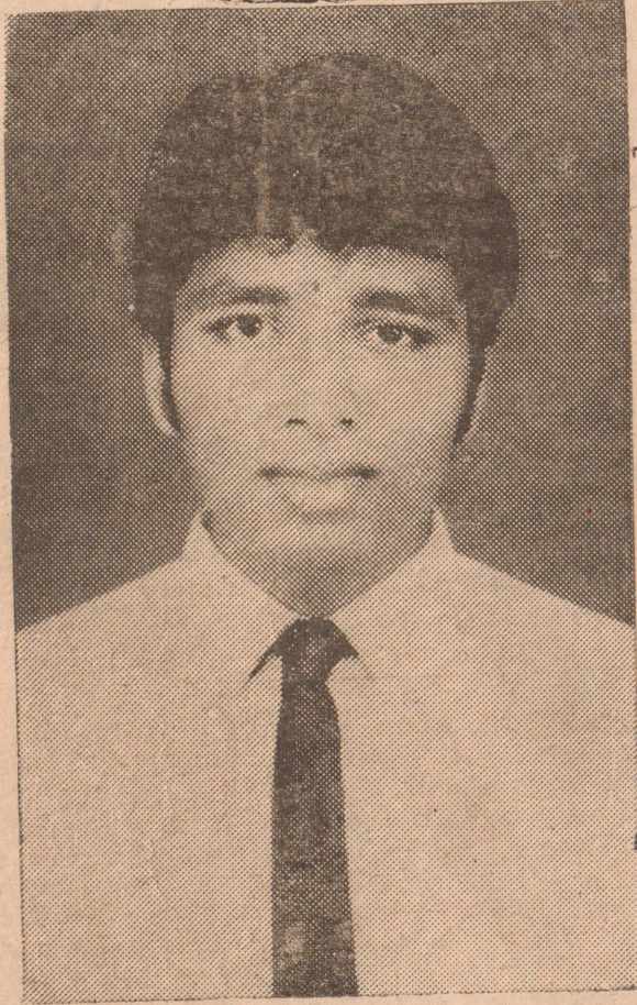
தியாகி வான் சிவகுமாரன் உரும்பிராய்

பிறப்பு: 26-08-1950 வீரச்சாவு: 05-06-1974