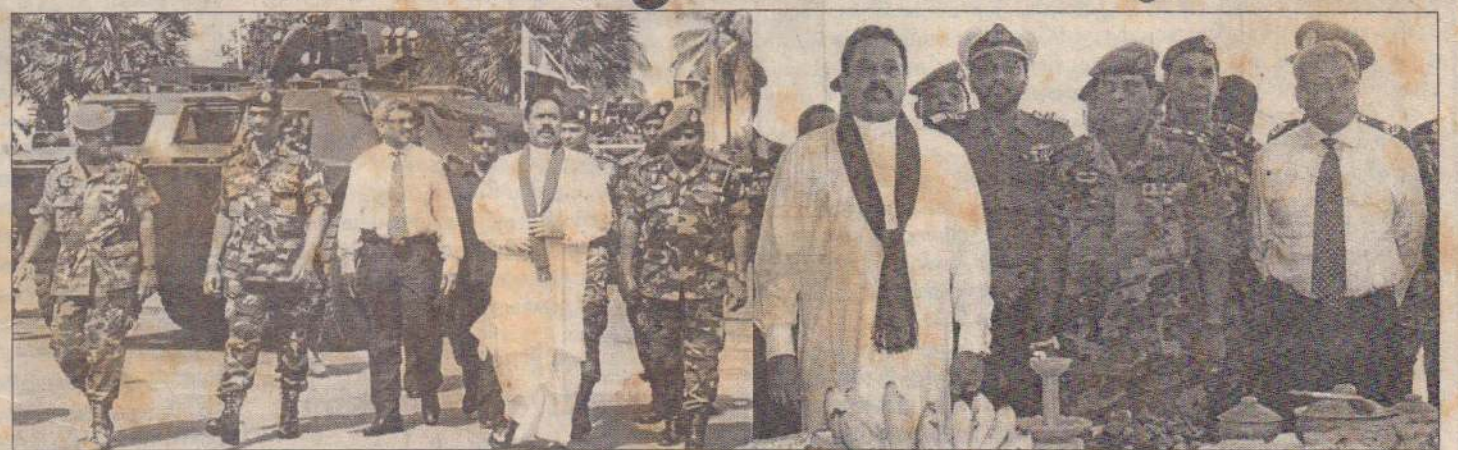
கிளிநொச்சி, ஏப்.17 பாதுகாப்புப் படையினரால் விடுவிக் கப்பட்ட கிளிநொச்சிக்கு ஜனாதிபதி மஹிந்த ராஜபக்ஷ நேற்று விஜயம் மேற் கொண்டார்.

சிங்கள - தமிழ் புத்தாண்டு நேரத்தில் படையினரைச் சந்திக்கவும் இடம்பெயர்ந்து வந்து நலன்புரி நிலையங்களில் தங்கி யுள்ள மக்களைச் சந்திக்கவும் ஜனாதிபதி நேற்று வன்னிக்கு விஜயம் மேற் கொண்