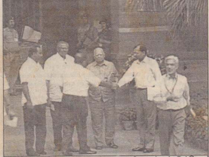
தமிழ் தேசிய கூட்டமைப்பு குழுவினருக்கும் இந்திய வெளியுறவுச் செயலாளர் சிவசங்கர் மேனனுக்கும் இடையில் நடந்த பேச்சுக்களின் பின்னர்.....

கண்டல் மருத்துவமனையினதும் சிகிச்சை நிலையங்களில் அனுமதிக்கப்பட்டுள்ளனர். இதேவேளையில் காயமடைந்தவர்க ளுக்கு 'திலிபன்' மருத்துவ சேவைப்பிரிவின ரும் சிகிச்சைகளை வழங்கி வருகின்றனர். மாத்தளன் மருத்துவமனைக்குச் செல் லும் வீதி படைவீரரின் கடுமையான வெல் தாக்குதல்களுக்கு இலக்காகியிருப் பதனால் காயமடைந்தவர்களை கொண்டு செல்ல முடியாத நிலை ஏற்பட்டுள்ளது - என்றுள்ளது. (அ-1)