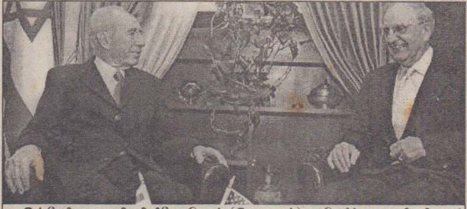
இஸ்ரேலிய ஜனாதிபதி சிமோ பெரஸ் (இடதுபுறம்), அமெரிக்க ஜனாதிபதி பராக் ஒபாமாவின் மத்திய கிழக்கிற்கான விசேட தூதர் ஜோர்ஜ் மிக்சேஜோன் ஜெருசலேமில் நேற்று விபாயக்கிரமை சந்தித்து உரையாடிய போது எடுக்கப்பட்ட படம்.

மென இவர்கள் தம் கடிதத்தில் கோரியுள்ளார்கள். இது போன்ற துணிகரமான நடவடிக்கைகளை இராணுவ அரசு தொடர்ந்து எடுக்க அனுமதிக்கக் கூடாது. ஆங்சான் சூகி, இராணுவ அரசு பிரதிநிதிகள் ஆகியோர் அடங்கிய முத்தரப்பு பேச்சுக்கள் நடத்த இராணுவ அரசை நிர்ப்பந்திக்க ஐ.நா. செயலாளர் நாயகம் பான் கி மூன் தனது அதிகாரத்தைப் பயன்படுத்த வேண்டும் என்றும் அந்தக் கடிதத்தில் கேட்டுள்ளனர். மியான்மாரில் நடக்க இருக்கும் தேர்தல் நேர்மையாகவும் சுதந்திரமாகவும் சர்வதேச சட்ட நிபந்தனைகளுக்கு உட்பட்டதாகவும் இருக்க வேண்டும். அரசு உயர் பதவிகளில் பெண்களுக்கு இடம் கொடுக்கத் தடை விதிக்கப்பட்டுள்ளது. இதைத் தடுத்து நிறுத்த வேண்டும். பெண்களுக்கு அரசு பதவிகளில் இடமளிக்க வேண்டும் என்றும் அந்தக் கடிதத்தில் இவர்கள் கோரியுள்ளனர்.