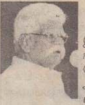
சென்னை, ஏப். 25

ஒரு ராஜீவ் உயிருக்கு இன்னும் எத்தனை லட்சம் ஈழத் தமிழர்கள் இரையாக வேண்டும்? புறக்கீடுவெடுத்து அகத்தே கறுத்துள்ள சோனியாவே சொல்லிவிடுங்கள் - என்று சுவிலிஞர் புலமைப்பித்தன் கேள்வியெழுப்பியுள்ளார்.