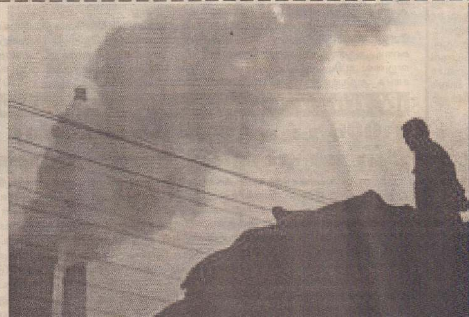
அமெரிக்க தென் கரோலினா மாநிலத்தில் தூரிகமாகப் பரவிவரும் காட்டுத் தீயை கட்டுப்படுத்தும் பணியில் தீயணைப்புப் படையினர் ஈடுபட்டுள்ளனர். ஒரு தீயணைப்புப் படை வீரர் பரவி வரும் தீயை அவதானிப்பதைப் படத்தில் காணலாம்.