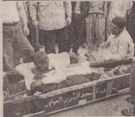
பக்தாத், ஏப். 25

ஈராக்கில் இடம்பெற்ற இரு தற்கொலைக் குண்டுத்தாக்குதல்களில் 76 பேர் பலியாகினர். என்பதுக்கு மேற்பட்டோர் காயமடைந்தனர். பலியானோரில் பெண்களும் குழந்தைகளும் அடங்குவர் என அதிகாரிகள் தெரிவித்தார்கள்.