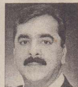
இஸ்லாமாபாத், ஏப். 25

பாகிஸ்தான் பிரதமர் யூசுப் ரஜா கிலானியை கொல்லத்தீவிரவாத அமைப்புகள் சதித்திட்டம் தீட்டியுள்ளன என்று பாகிஸ்தான் உள்வது அமைப்பு தெரிவித்துள்ளது.