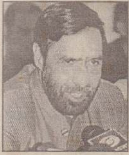
கொழும்பு, ஏப்ரல் 25 இலங்கையின் வன்னிப் பகுதியில் காணப்படும் மனிதாபிமான அலகம் குறித்த இந்தியாவின் கரிசனையை நேரடியாகத் தெரிவிப்பதற்காக இந்திய வெளிவிவகார செயலாளர் சிவ் சங்கர் மேனனும்,

தேசிய பாதுகாப்பு ஆலோசகர் எம்.கே. நாராயணனும் நேற்று கொழும்பு பிற்கு திழை விஜயமொன்றை மேற்கொண்டனர். இதற்கிடையில் இலங்கை விவகாரத்தில் கரிசனை காட்டுவதை விட, அதற்கு அப்பால் எதனையும் செய்ய முடியாது. எமக்குள்ள வாய்ப்புக்கள் மட்டுப்படுத்தப்பட்டுள்ளன என்று பிரதி வெளிவிவகார அமைச்சர் ஆனந்த் சர்மா தெரிவித்திருக்கிறார். வெள்ளிக் கிழமை 11.30 மணிக்கு கொழும்பை வந்தடைந்த இந்திய - தேசிய