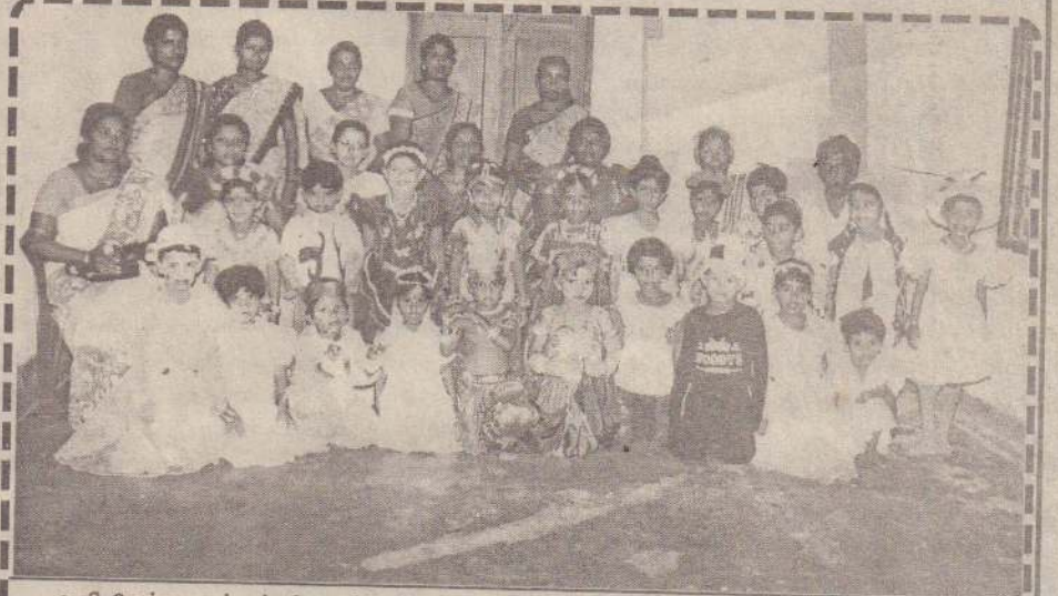
வலிமேற்கு முன்பள்ளி ஆசிரியர் சங்கத்தினர் வலிமேற்கு பிரதேச சபையுடன் இணைந்து முன்பள்ளிச் சிறார்களின் அபிநயப் பாடல்திறன் விழாவை அண்மையில் நடத்தினர். இந்த விழாவில் பங்குபற்றிய சிறார்களையும், முன்பள்ளி ஆசிரிய சங்க நிர்வாகத்தினரையும் படத்தில் காணலாம். (28)