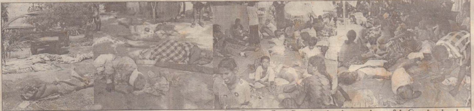
முல்லைத்தீவில் மக்கள் பாதுகாப்பு வலயப் பகுதி மீது நேற்று மேற்கொள்ளப்பட்ட தாக்குதலில் கொல்லப்பட்டவர்களை முதல் இரு படங்களிலும் காயமடைந்தவர்களை அவர்களது உறவினர்கள் கட்டாந்தரையில் வைத்துப் பராமரிப்பதை அடுத்துள்ள படங்களிலும் காணலாம்.