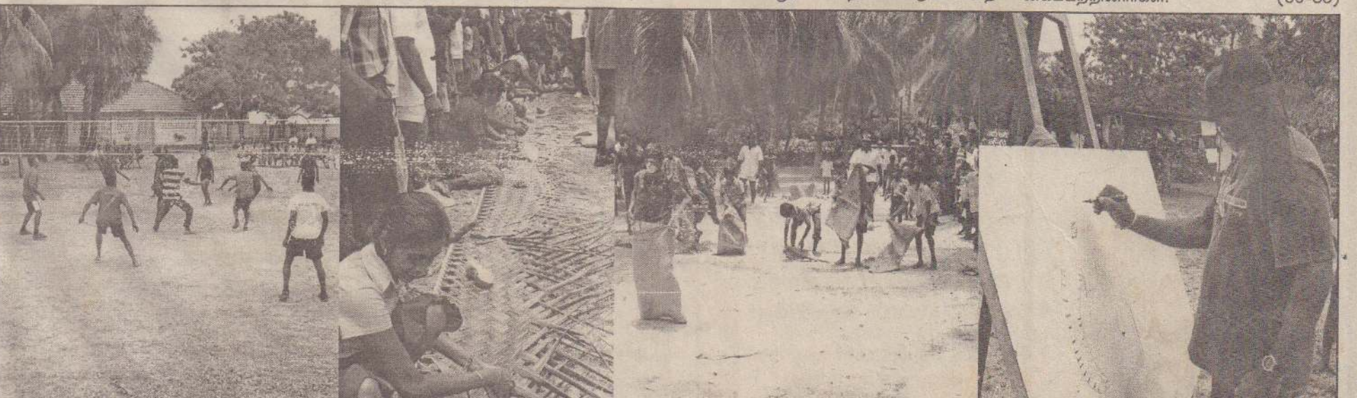
நெடுந்தீவு கடற்படையினரார் புதுவருடத்தை முன்னிட்டு நடத்திய விளையாட்டுப் போட்டிகளில் கரப்பந்தாட்டம், கிடுகு பின்னூதல், சாக்கு ஓட்டப் போட்டிகளில் கலந்துகொண்டவர்களைப், நெடுந்தீவு யாழ்ப்பாண அறிவுசெய்யப்பட்டவர்களைக் கண்டவைக்கும் போட்டியில் கலந்துகொள்வதையும் படங்களில் காணலாம்.