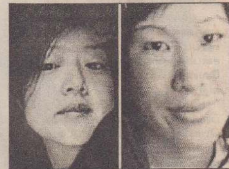
வாஷிங்டன், ஏப். 25

வடகொரியாவில் இரு அமெரிக்க ஊடகவியலாளர்கள் கைது செய்யப்பட்டார்கள். சீனாவுடன் ஒட்டிய வடகொரிய எல்லையில் கைது செய்யப்பட்ட இவ்விருவரும் விசாரணைக்கு உட்படுத்தப்பட்ட