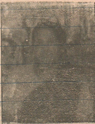
நாட்டுப் பற்றாளர் திருமதி