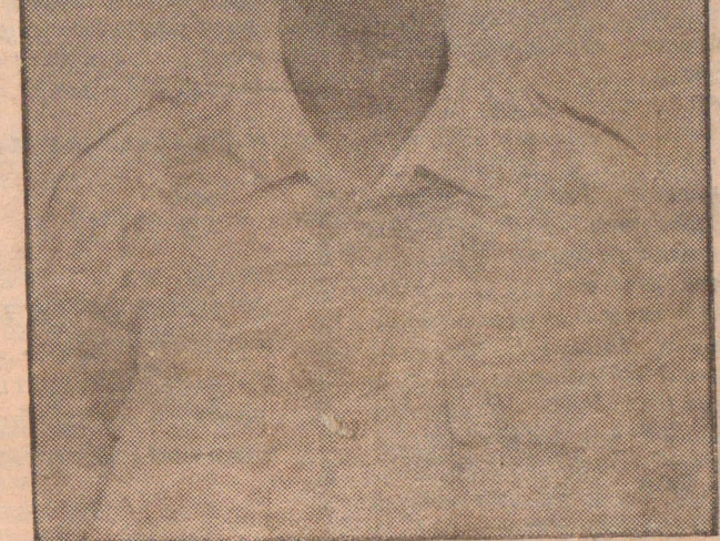
கடற்கரும்புலி கப்டன் அங்கயற்கண்ணி

கிளாலி - பூநகரி படகுச்சேவை இன்று வழமையான நேரத்திற்கு நடைபெறும் என அரசியல் துறையினர் அறிவித்துள்ளனர்.