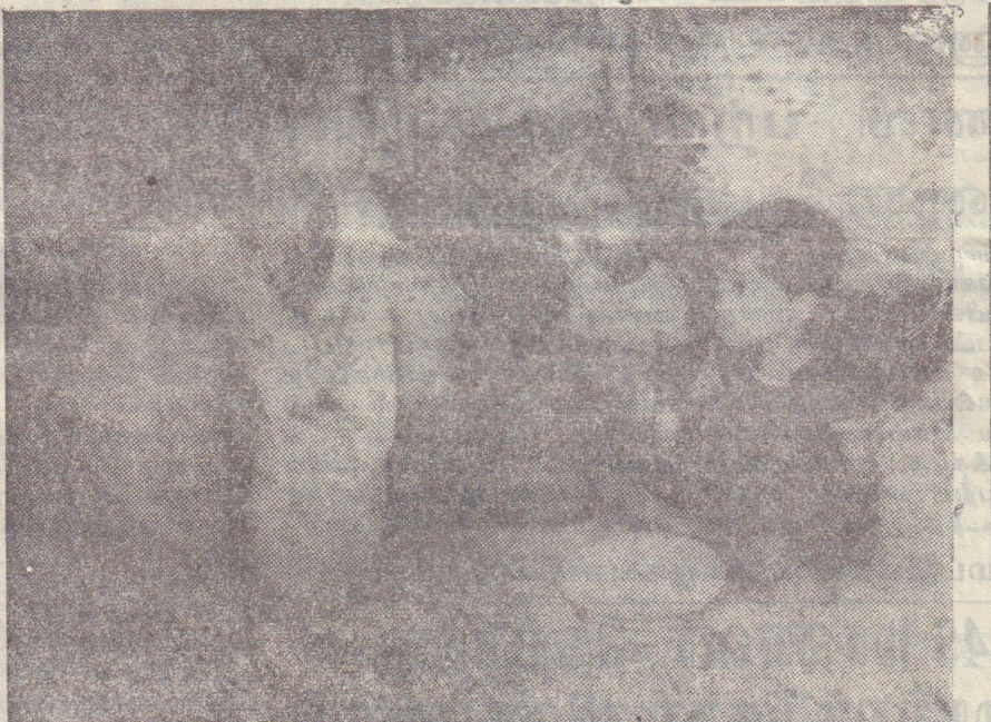
எமக்கு எப்போதுதான் ஒழுங்கான சாப்பாடு கிடைக்கும்? பாட்டியிடம் பார்வையாலே கேள்வி கேட்கும் பேர்கள்.