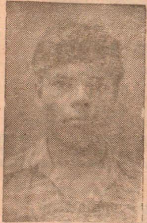
வெப். திண்ணியன் (ரங்கா)

இராணுவ வட்டாரங்களின் உள்ஜிதம் செய்துள்ளன. காயமடைந்தவர்களில் 120 பேர் ஆபத்தான காயங்களுக்கு உள்ளாகியுள்ளனர். 250 படையினர் படுகாயமடைந்தனர் என அவ்வட்டாரங்கள் மேலும் தெரிவித்தன. இத்தவேளை இச்சமரில் 250 கடற்படை, இராணுவத்தினரின் சடலங்கள் மீட்கப்பட்டுள்ளதாகவும் மேலும் 500 பேர் காணாமல் போயிருப்பதாகவும் இராணுவ அதிகாரிகளை மேற்கோள் காட்டி ஏஜென்சி செய்திகள் தெரிவித்தன.