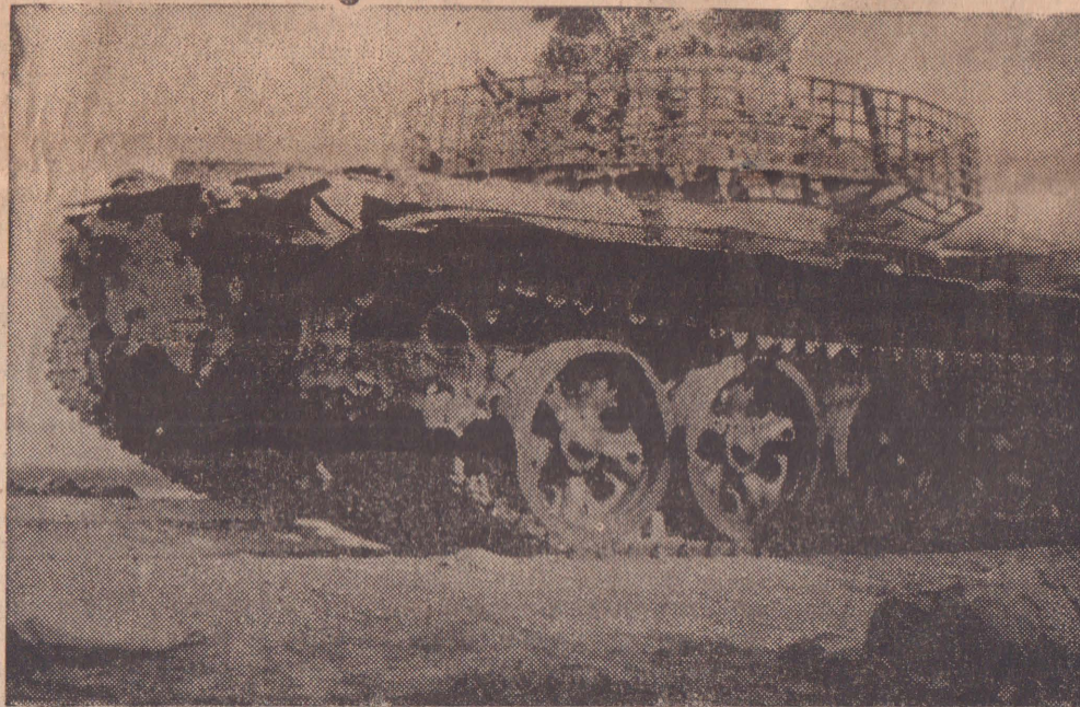
பூநகரி படைக்களத்தில் புலிகளால் கைப்பற்றப்பட்ட பாட்டி

11 : கிளாலி கடற் கடற்புலிகள் - காக் கடற்படை மோதல்; பயணிகை வந்த கடற்படை ஊர்வலம்; மக்களைக் பணியில் லெப். தே சாள்ஸ் உட்பட இரு புலிகள் வீரச்சாவு.