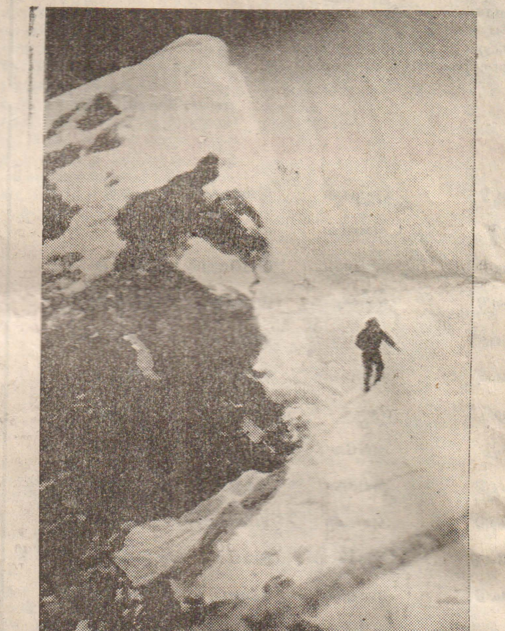
எவரெஸ்ட் உச்சியை எட்டுவது என்பது கரணப் பொறிக்குக் போய் வருவது போன்றது.

தாழி உடைந்த கதை ஆகி விடலாமா? ஓய்ந்தால் நிரந்தர ஓய்வுதான் ஒரு கல் உருண்டை உயரத்தில் இருந்து வந்து முன்