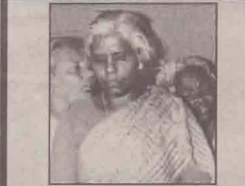
39 வருடம் சளி அடைப்பிலிருந்து ஜெபத்தின் மூலம் விடுதலைபெற்றவர்.

தொடர்பு: கியேசு ஜீவீக்கிறார், 401, சிளுத்தமாவத்தை வீத, கொழும்பு - 15 கு.பெ.இல. 1044, கொழும்பு, T.P. : 522608