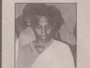
10 வருட தலைவலியிலிருந்து ஜெபத்தின் மூலம் விடுதலைபெற்றவர்.