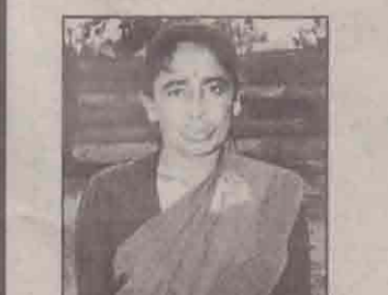
15 வருடம் உடைந்த காலினால் நடக்கமுடியாது வேதனைப்பட்டவர் ஜெபத்தின்மூலம் சுகம்பெற்றவர். (94917)