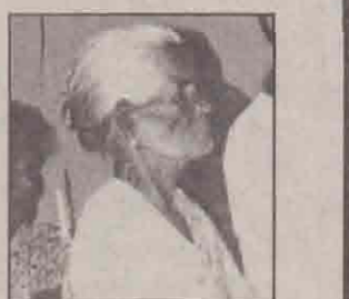
30 வருட மூட்டு வலியிலிருந்து ஜெபத்தினால் விடுதலைபெற்றவர்.