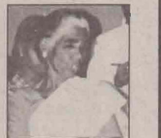
5வருடம் வாயில் புண் ஜெபத்தின்மூலம் விடுதலை பெற்றார்.