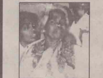
10 வருட தெளிவுற்ற பார்வையிலிருந்து ஜெபத்தின் மூலம் விடுதலைபெற்றவர்.