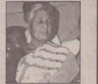
3வருடம் காது கேட்காமல் கிருந்தவர் ஜெபத்தின்மூலம் சுகம்பெற்றார்.