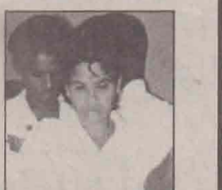
4வருடமாக அகத்தாவியின் பிடயில் கிருந்தவர் ஜெபத்தின்மூலம் சுகம்பெற்றார்.