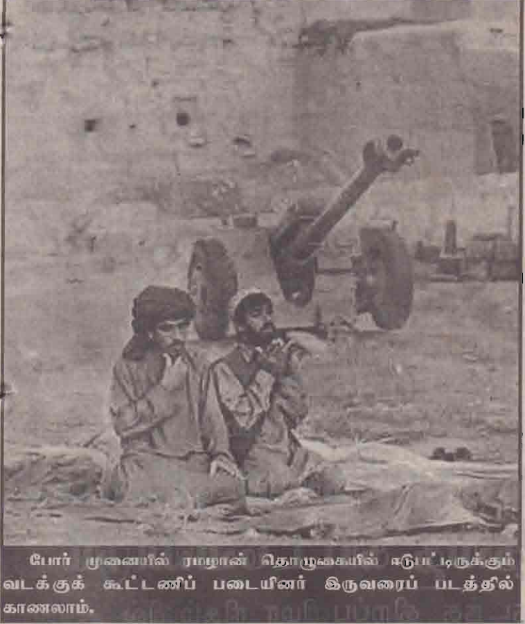
போர் முனைவில் ராஜாஸ் நிதாமுகையில் ஈடுபட்டிருக்கும் வடக்குக் கூட்டணிப் படையினர் இருவரும் படத்தில் காணலாம்.